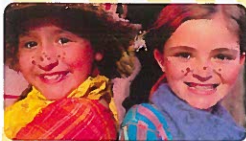
Johnny Appleseed Campamento de teatro musical para edades de 6 a 14 años 16-20 de agosto

TODOS LOS CAMPAMENTOS CONCLUYEN EN UN MOSTRAR A ESCALA COMPLETA EN NUESTRO ¡ETAPA!