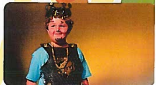
Twisted Fairytales Compañía de teatro Tween para niños de 8 a 12 años 9-12 de agosto