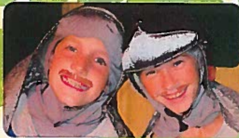
The Emperor's New Clothes Campamento de teatro musical para edades de 6 a 14 años 12-16 de julio