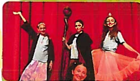
Twisted Fairytales Tween Theatre Troupe for ages 8-12 August 2-5