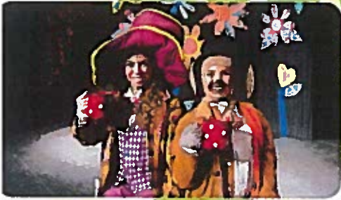
Alice in Wonderland Campamento de teatro musical para edades de 6 a 14 años 5-9 de julio