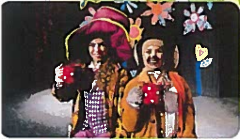
Alice in Wonderland Musical Theatre Camp for ages 6-14 July 5-9