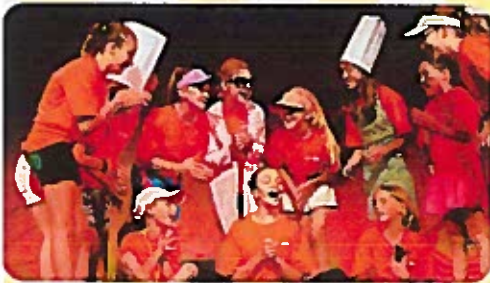
Seashore Shenanigans Tween Theatre Troupe for ages 8-12 July 26-29