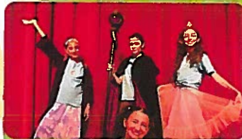
Twisted Fairytales Compañía de teatro Tween para niños de 8 a 12 años 2-5 de agosto