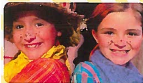
Johnny Appleseed Musical Theatre Camp for ages 6-14 August 16-20

ALL CAMPS CONCLUDE IN A FULL SCALE SHOW ON OUR STAGE!