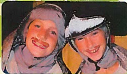
The Emperor's New Clothes Musical Theatre Camp for ages 6-14 July 12-16