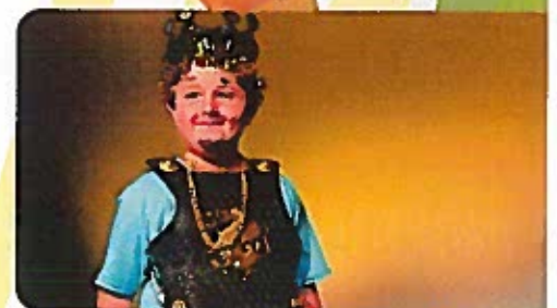
Twisted Fairytales Tween Theatre Troupe for ages 8-12 August 9-12