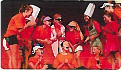
Seashore Shenanigans Compañía de teatro Tween para niños de 8 a 12 años 26-29 de julio